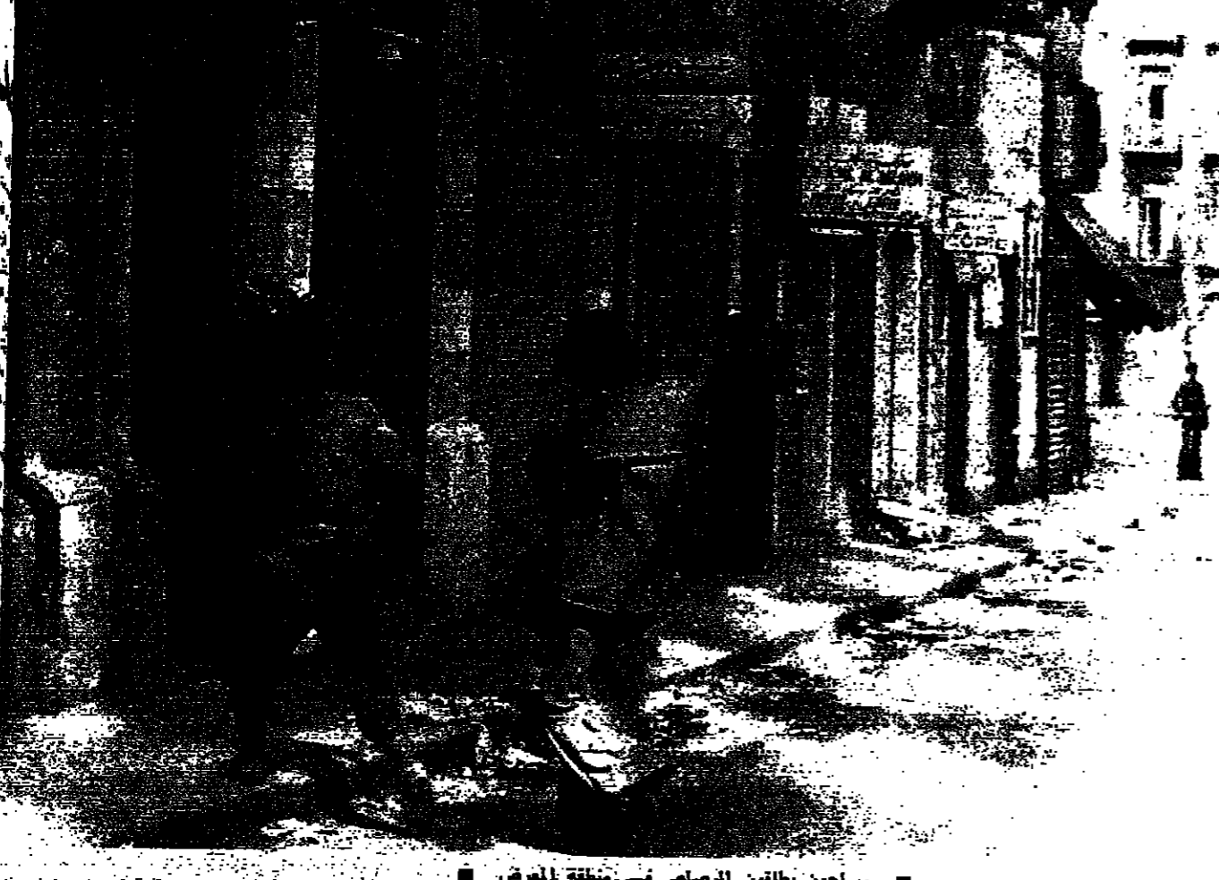
■ مسلحون يطلون الرصاص نسي منطقة المعرض